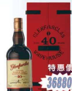
格蘭花格40年 單一麥芽威士忌禮盒