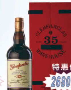
格蘭花格35年 單一麥芽威士忌禮盒