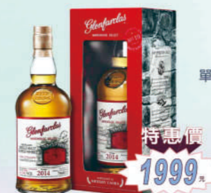
2014 紅門窖藏原酒 單一麥芽威士忌 (第一版)

為一款獨特、有趣，有著愉悅的衝突感的作品雪莉桶帶來的果乾外，有著焦糖、梅子乾似的深層氣息入口滑潤，油脂豐富，酒體紮實充滿變化結合淡淡的木質調性，品飲起來充滿驚奇。