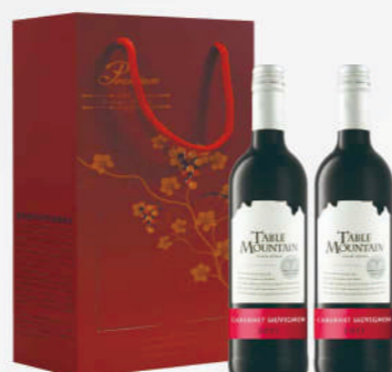
南非桌山卡伯內紅酒