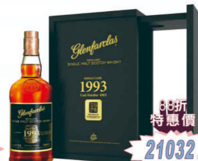
格蘭花格福爾摩沙1993年 雪莉4803桶原酒