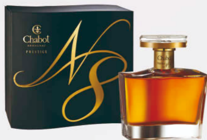
夏堡雅邑帝寶 8 號白蘭地