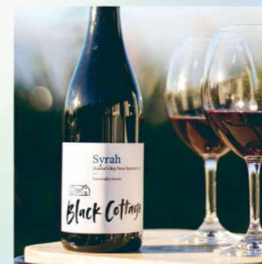
黑木屋 霍克斯灣 席拉紅葡萄酒 HAWKE'S BAY SYRAH

美味的席拉呈現明亮的深紅色，充滿了藍色水果、梅子、紫羅蘭和香料的風味。口感中有著迷人的土壤風味，伴隨著覆盆子、花香和一絲黑胡椒的味道。豐滿的單寧和強勁的口感使酒的餘韻更加圓潤。