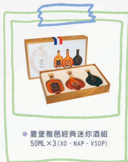
夏堡雅邑經典迷你酒組 50ML×3(XO、NAP、VSOP)

最少陳年儲放六年，並且與陳年儲放20年以上的雅邑白蘭地混合調配後才裝瓶。 一盒原價 2380 元 一盒特價 1900 元 三盒特價 5200 元