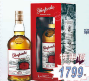
2015 紅門窖藏原酒 單一麥芽威士忌 (第一版)

展現雍容華貴與清新的雙重性格，值得慢慢品味香氣上著如清新松葉般的木質清香隨之而來甜美的果香與龍眼蜜香入口感受到延續的柑橘糖蜜，口感濃郁結尾有著絲絲甘草的清甜，餘韻不斷。