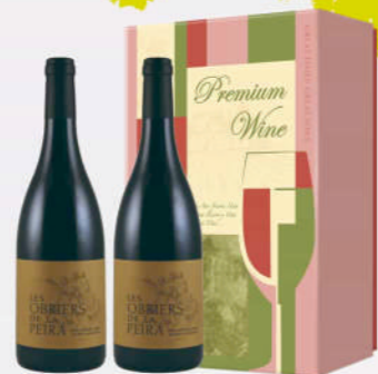
13' / 16' 歐伯瑞精選陳釀紅酒