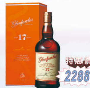
格蘭花格17年 單一麥芽威士忌禮盒