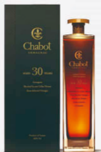
夏堡雅邑30年水晶瓶