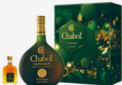
夏堡雅邑拿破崙禮盒(贈NAP迷你酒)

夏堡系列最暢銷的雅邑白蘭地。水晶雕琢長頸酒瓶，為夏堡獨家設計。23~35年橡木桶陳年。 一盒原價 3380 元 一盒特價 2800 元 三盒特價 7800 元