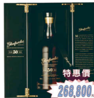
格蘭花格珍稀典藏50年威士忌