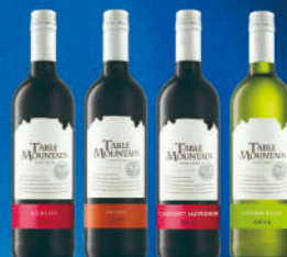
南非桌山系列葡萄酒