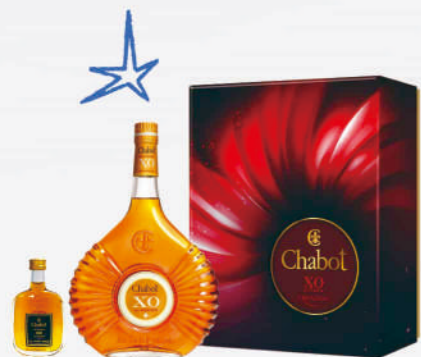
夏堡雅邑X.O禮盒(贈X.O迷你酒)

支持永續海洋計畫，藍、白、紅色外觀代表法國製造，Chabot設計獨特瓶身一融合陰陽和諧的禪意線條，靈感源自海浪。由COLOMBARD、UGNI BLANC、BACO等葡萄釀成，在法國橡木桶中陳釀 25 年以上，還調配高達50年的陳酒。深琥珀色和明亮紅銅色反射，入口圓潤濃郁，飄散浪漫的香草和煙草香氣，持久尾韻迷人芬芳。