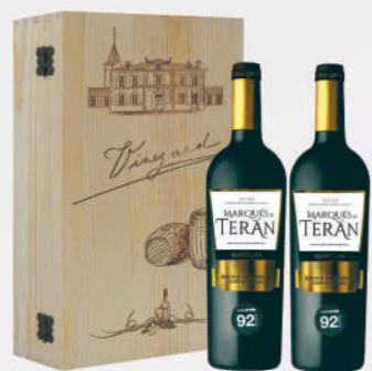
德朗侯爵限量版典藏紅酒