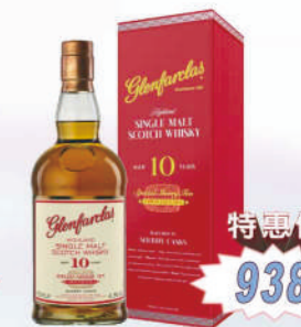
格蘭花格10年 單一麥芽威士忌