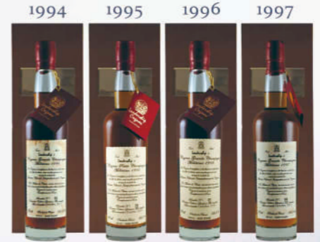
★每盒皆附：1.原木高級木盒 2.精美鑰匙 3.證書