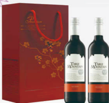
南非桌山席拉紅酒