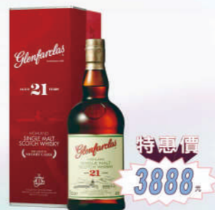
格蘭花格21年 單一麥芽威士忌