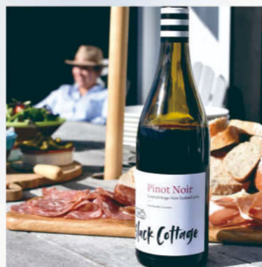
黑木屋 中奧塔哥 黑皮諾紅葡萄酒 CENTRAL OTAGO PINOT NOIR

黑皮諾擁有深紅寶石色，散發出複雜的香氣，包括黑森林水果、野百里香和微妙的煙燻味。口感上有鮮豔的黑莓和櫻桃風味，質地光滑，酸度細膩，單寧柔軟。味道。豐滿的單寧和強勁的口感使酒的餘韻更加圓潤。