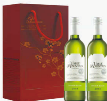
南非桌山白詩楠白酒