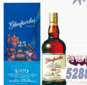
格蘭花格25年雪莉桶 單一麥芽威士忌禮盒