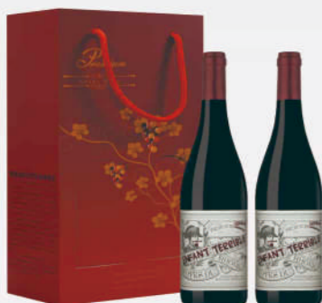
壞小孩精選紅葡萄酒