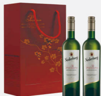
南非尼德堡釀酒師蘇維翁白酒