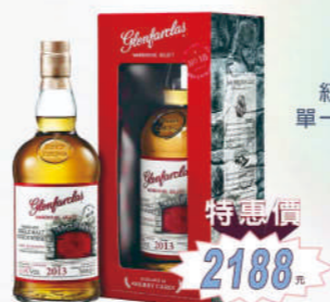
2013 紅門窖藏原酒 單一麥芽威士忌 (第一版)