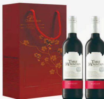
南非桌山梅洛紅酒